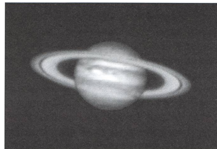
Jupiturne!!! Prototype de la manipulation d'image, ici délibérée et avouée. Compositage du disque de Jupiter et des anneaux de Saturne. Image CCD de BASTIEN CONFINO. Observatoire FXB. St-Luc (VS)

ment en mode suivi et en mode acquisition d'images. Les prix sont bien entendu plus élevés, mais comme dans tout ce qui concerne les développements en électronique et en informatique, les performances augmentent de manière spectaculaire, et les prix baissent. Il ne faut donc pas se montrer trop impatient.