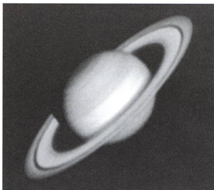
Compositage de 15 clichés CCD. Pose 0,5 s. Caméra Hi-Sis 22. Sur un télescope Meade de 300mm ouvert à F/44. A relever la remarquable résolution (la division de Cassini, visible sur toute sa longueur mesure 0,2" d'arc devant la planète).