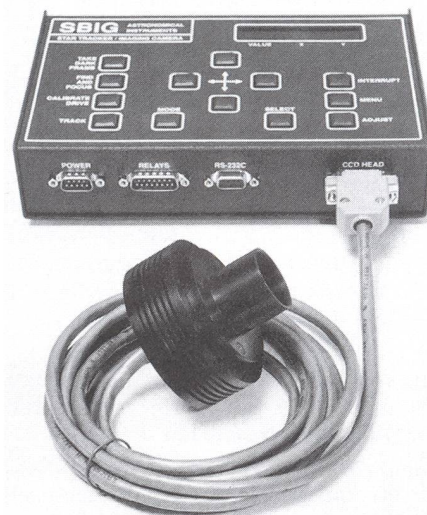
La caméra ST4 de SBIG (Santa Barbara Instrument Group) a une matrice de 165 x 192 pixels. Elle est refroidie par effet Peltier. Elle est ici accompagnée de sa palette de commande.

La grande sensibilité (de l'ordre de 20 000 ISO) de la caméra permet soit d'assurer le suivi sur des étoiles guidées très faibles (magnitude 8), soit de donner des images d'objets peu lumineux en