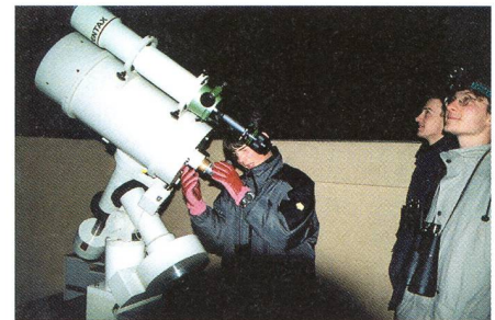
Fig. 1: Ein MESSIER-Marathon ist mit manchen Wartezeiten verbunden.

Beendet wurde der ungewöhnliche Marathon erst um 5.30 Uhr mit der MESSIER-Nummer 6, einem eben aufgehenden offenen Sternhaufen im Skorpion. Er zeigte sich im Gesichtsfeld sinnigerweise zusammen mit einem Baumwipfel des Eschenbergwaldes und merklich erblasst in der langsam aufkommenden Morgendämmerung. Mindestens drei weitere Objekte wären noch in Griffnähe gewesen, doch machte sich ausgerechnet tief am Südosthorizont die am Alpenkamm gestauten Wolken bemerkbar.