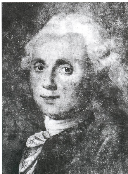
Fig. 2: Das «Kometenfrettchen» CHARLES MESSIER in einer zeitgenössischen Darstellung