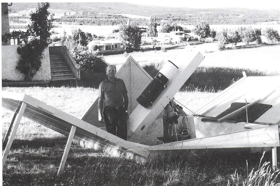
Fig. 1. Die Klapphütte mit dem 21-cm Newton und der 20/22/30-cm Schmidtkamera