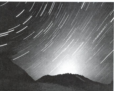
Astrofotographie - 16