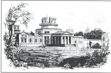
Pulkovo - Das Zentralobservatorium der Russischen Akademie der Wissenschaften - 4