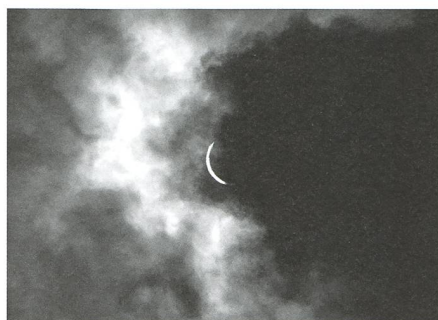
Eclipse de Soleil / NOËL CRAMER - 8