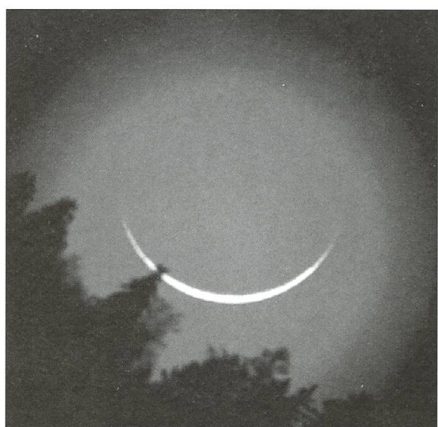
Astrofotographie / DANIEL CEVEY - 28