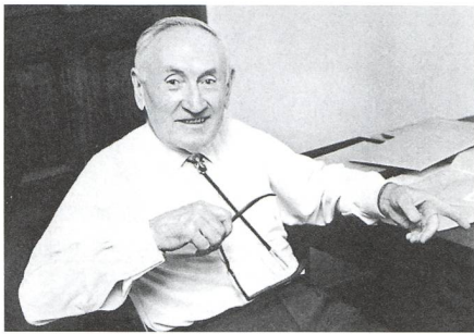
Fritz Zwicky's Pionierarbeiten... - 8