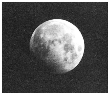
Tiefe Halbschatten-Mondfinsternis fast partiell