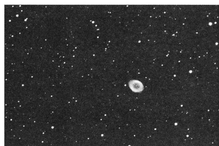
La CCD? Mais c'est très simple!