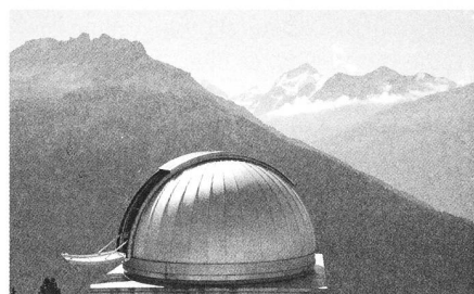
Observatoire François-Xavier Bagnoud