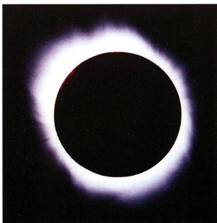
Eclipse du 26 février 1998 (Aruba). Soleil éclipse avec Jupiter (optique de 400 mm)