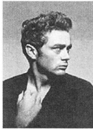
James Dean (1931-1955)

À la sortie d'une séance de planétarium, une bande de jeunes turbulents et une égérie fugueuse provoquent un nouveau venu dans leur quartier. L'affrontement sur la terrasse de l'édifice dégénère en une bagarre au couteau à laquelle il est heureusement mis fin par un des gardiens du site.