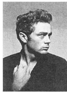
James Dean (1931-1955)

À la sortie d'une séance de planétarium, une bande de jeunes turbulents et une égérie fugueuse provoquent un nouveau venu dans leur quartier. L'affrontement sur la terrasse de l'édifice dégénère en une bagarre au couteau à laquelle il est heureusement mis fin par un des gardiens du site.