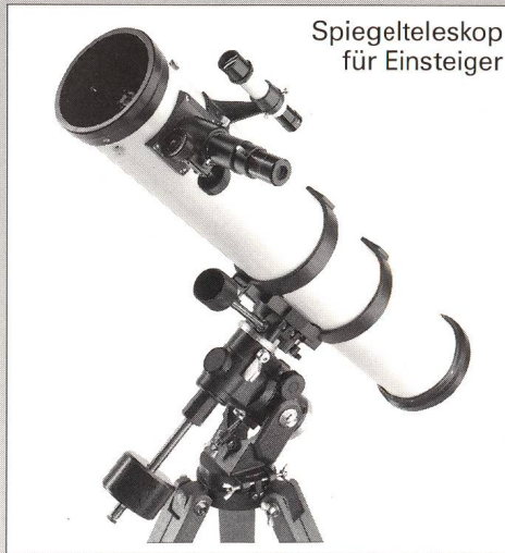
Spiegelteleskop für Einsteiger