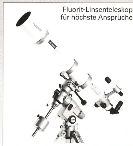
Fluorit-Linsenteleskop für höchste Ansprüche