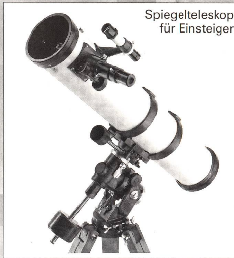
Spiegelteleskop für Einsteiger