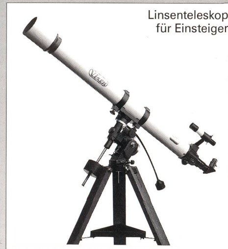
Linsenteleskop für Einsteiger