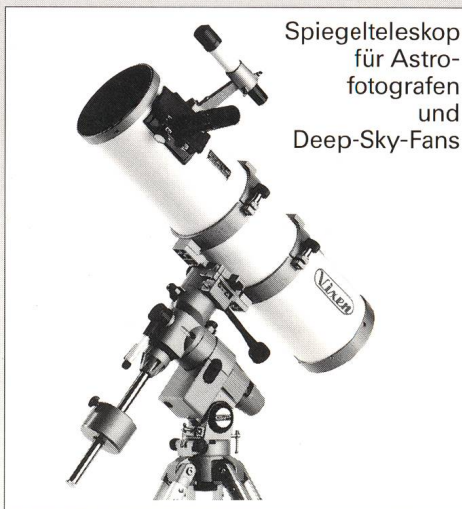
Spiegelteleskop für Astro- fotografen und Deep-Sky-Fans