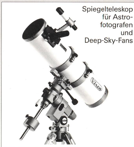
Spiegelteleskop für Astro- fotografen und Deep-Sky-Fans