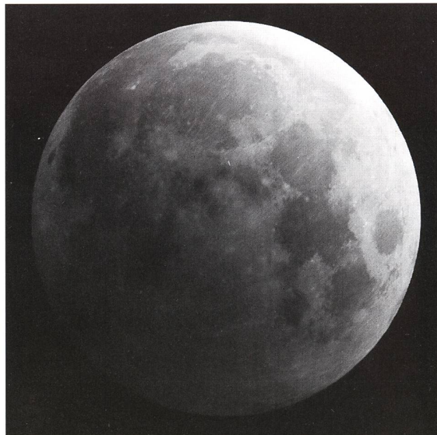
Dervoll in den Erdschatten eingetauchte Mond, um ca. 4.20 Uhr MESZ fotografiert durch das 250/2000mm-«Friedrich-Meier»-Teleskop der Sternwarte Eschenberg. Belichtung: 10 Sekunden auf Kodacolor 200. Beachte auf der linken Seite die beiden Lichtpunkte von SAO 109078 (6.9 m) und SAO 109084 (7.4 m).