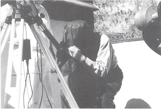
Bild 3: Das «schwarze Loch Howald» beim Betrachten einer Protuberanz. «Es esch e cheibe Schöni!».