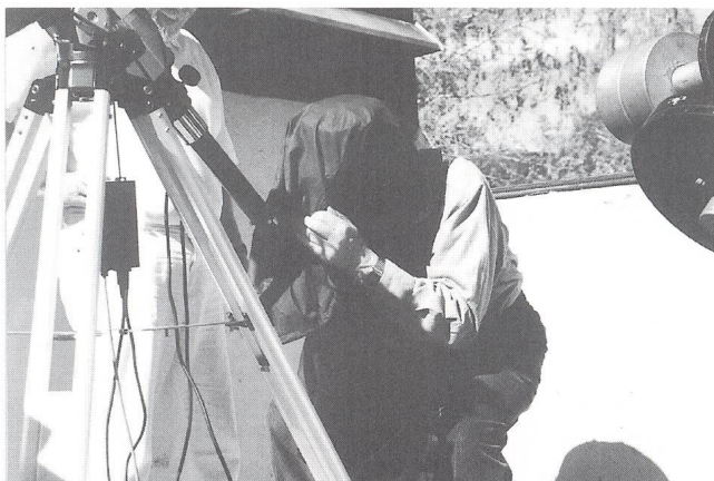
Bild 3: Das «schwarze Loch Howald» beim Betrachten einer Protuberanz. «Es esch e cheibe Schöni!».