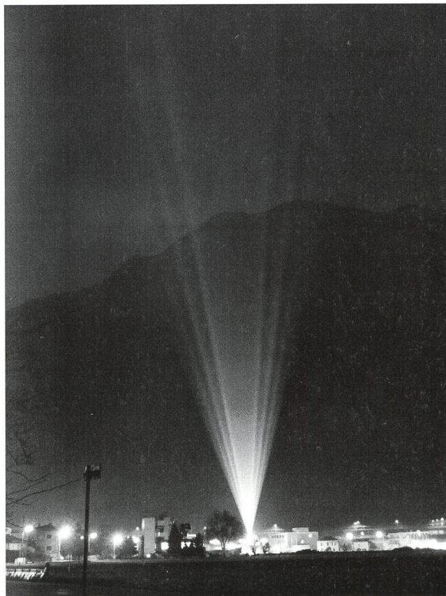
Foto 1: Proiettori installati in una discoteca di Bellinzona nel gennaio 1994

Ho vissuto la mia infanzia nella campagna vicino a Santiago di Compostela (Spagna). Mi ricordo alcune notti passate ad osservare il firmamento disteso sul prato, sentivo i grilli cantare ed in lontananza vedevo la luna che si stagliava dietro il campanile della chiesa. Oggi, a distanza di 25 anni, la chiesa è