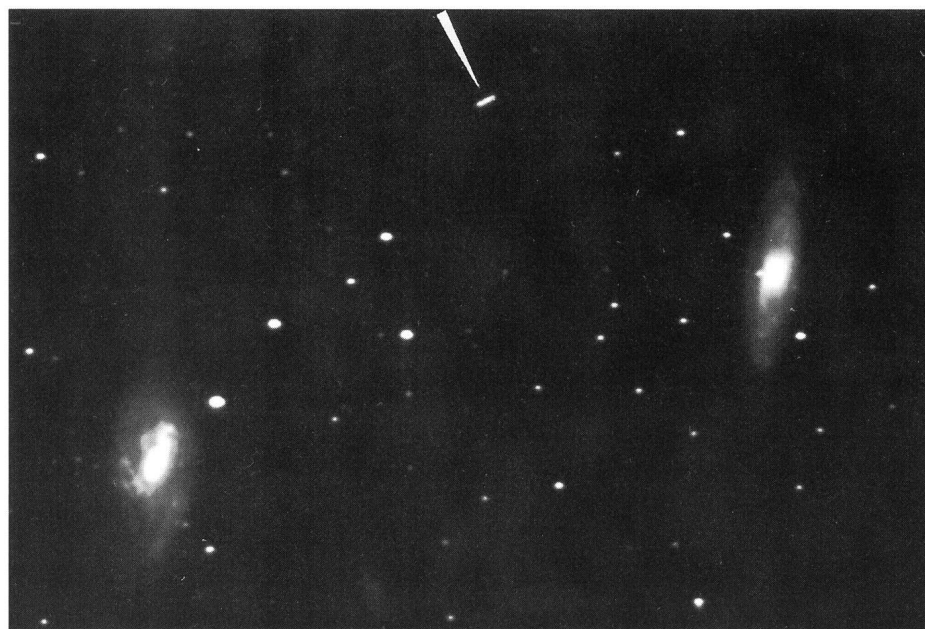
Figure 1: M65, M66 et l'astéroïde Palatia (flèche). Télescope C8 Ultima avec réducteur de focale (F/D=6,8) en suivi manuel. Pose: 1 heure.