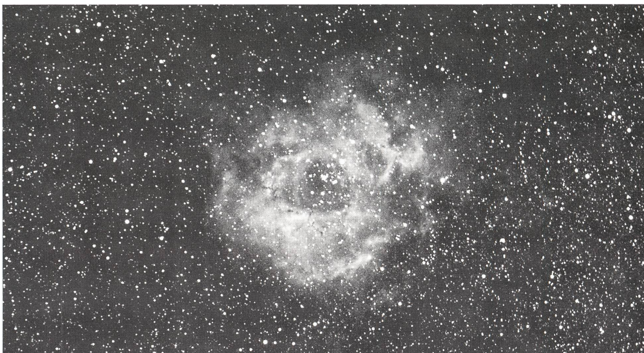
La Nébuleuse de la Rosette