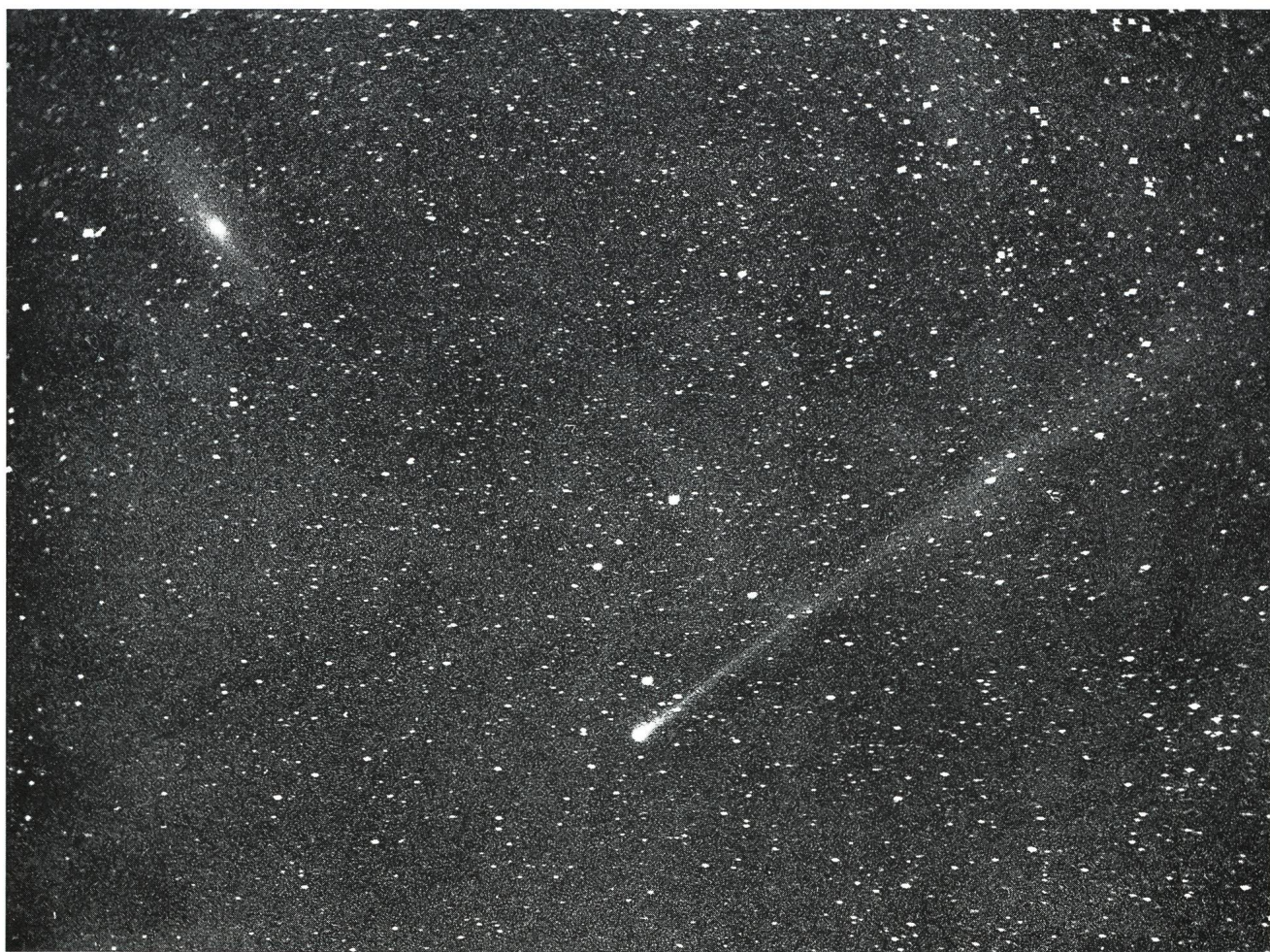
Komet Austin neben M31, Photo A. Müller, Meilen, 29.4.90