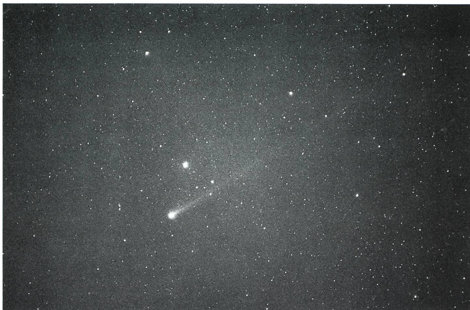
Comète Austin, 29.4.90. Pose de 6 min. à 4 h 00 TL. Film imax 3200. Téléobjectif 400 mm fld 5.5