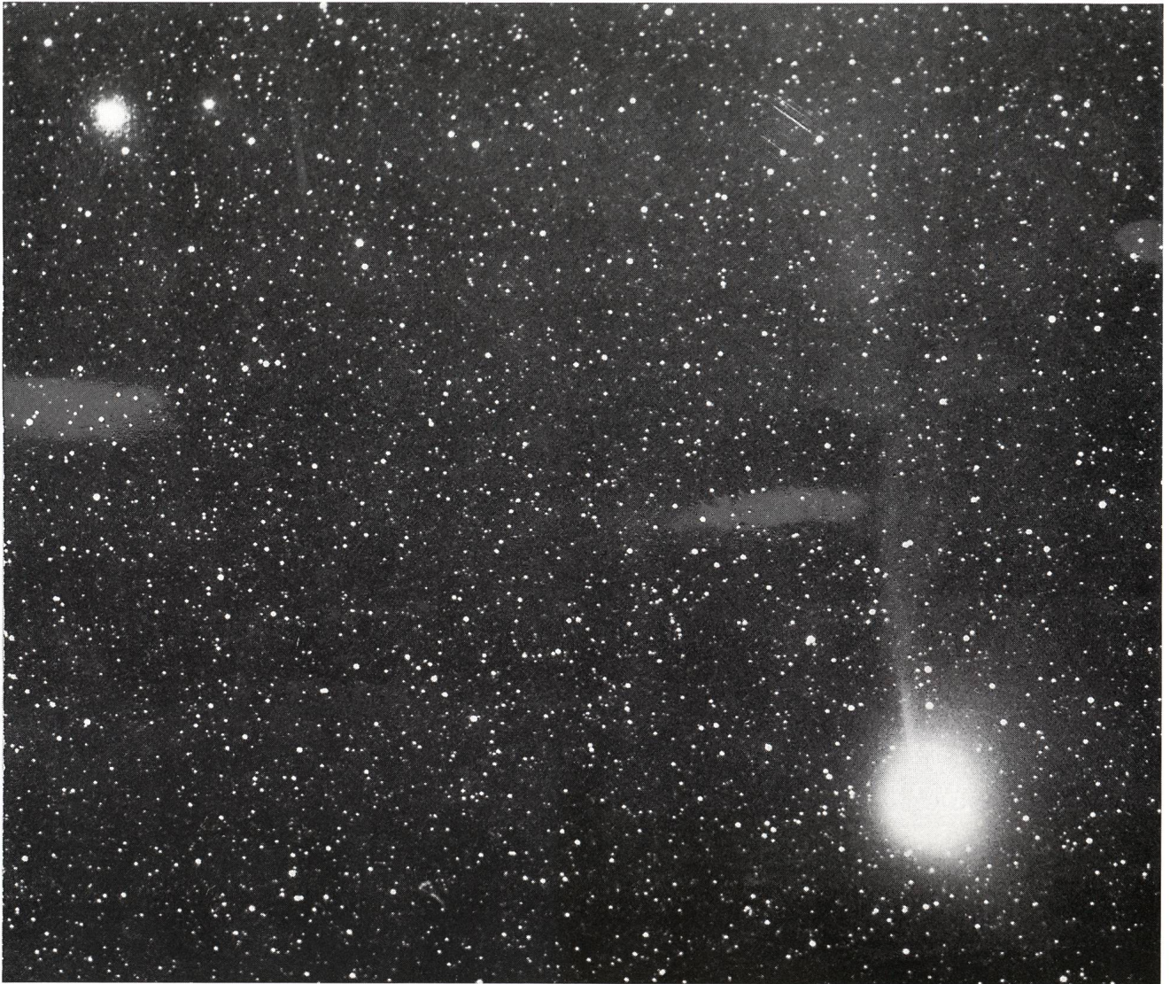
Komet Levy mit M15. 17.8.90; 22 h 47 UT; 5.5" Celestron-Schmidt; TP 2415 hypers.; 8 min.