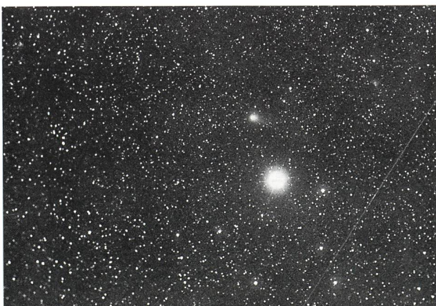
Komet Levy 1990c neben Alpheratz (24.6.90; 8" Celestron Schmidt; TP 2415 hypersens.; 10 min.) Urs Straumann Oscar Frei-Strasse 6 4059 Basel