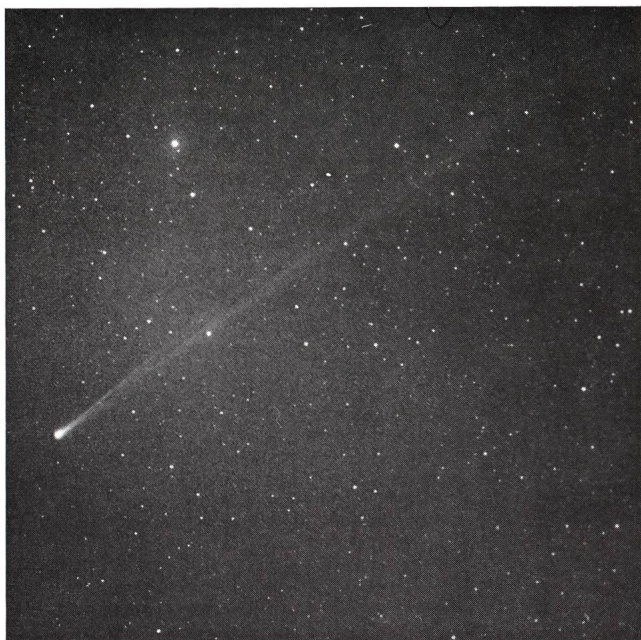
Komet P/Brorsen-Metcalf 6.9.89 - 02.56 U.T. Schmidt-Kamera 5.5". Film TP 2415/H. Belichtung: 4 min