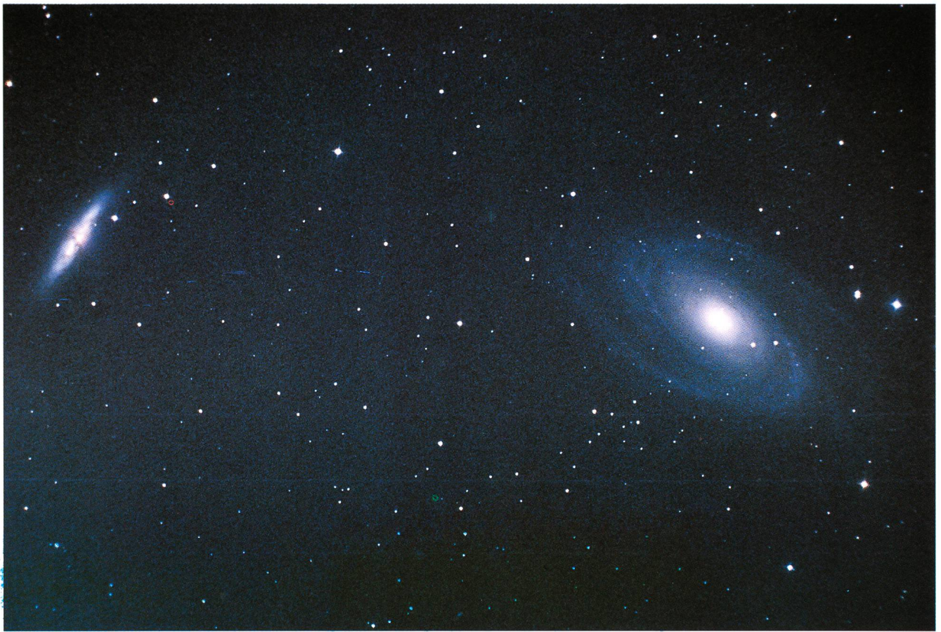
Galaxien M 81/82. Aufnahmedaten wie bei Bild 3, aber nur 35 min. In den Spiralarmen von M 81 sind Sternassoziationen als helle Knoten zu erkennen. Die eruptive Zentralzone von M 82 erscheint auf dunkler kopierten Abzügen kräftig rot gefärbt.