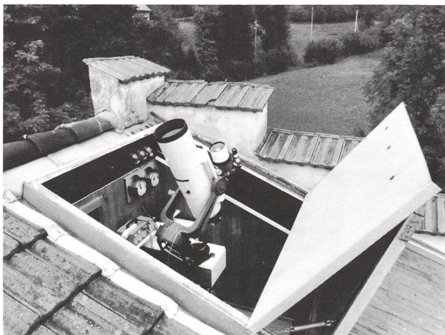
Abb. 2 Ansicht der Beobachtungsstation mit geöffnetem Faltdach

Vor Ungefähr 10 Jahren zog ich in das Haus «Sonnenbühl» in Weesen. Meine astronomische Ausrüstung bestand damals aus einem selbstgebauten Refraktor mit einem Achromaten von 600 mm Brennweite (Schweiz. Astro-Materialzentrale), später kam noch ein Celestron 8 Spiegelteleskop dazu.