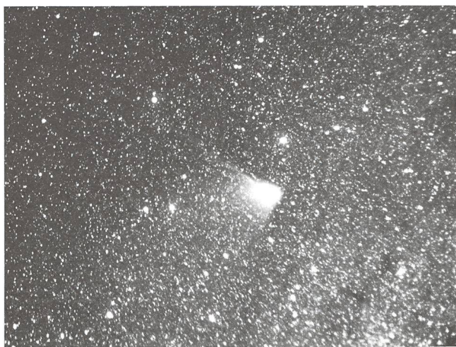
Halley dans la constellation du Loup, aux «confins» de la voie Lactée

FRANCIS BÉROUD, Le Bénévís 20, CH-2732 Reconvilier