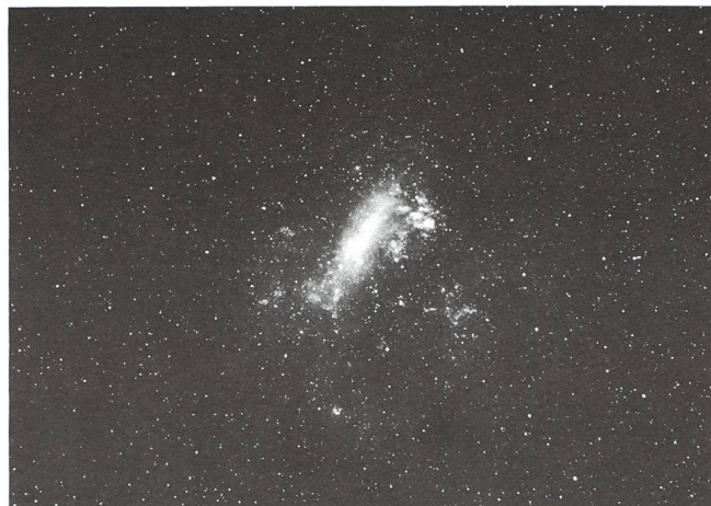
Abb.8. Die Grosse Magellansche Wolke. 10.4.86, 18.35 UT, Belichtung 10min auf TP 2415 hyper., 55mm, Blende 2.8.

Bei dieser Aufnahme wurde mir der unglaubliche Fortschritt in der Phototechnik besonders stark bewusst: Beim Durchblättern alter Astronomiebücher fand ich nämlich genau die gleiche Aufnahme, allerdings vor rund 50 Jahren mit einem Tessar auf dem Mt. Wilson photographiert. Beide Bilder sind qualitativ gleichwertig. Um die Mt. Wilson-Aufnahme zu erhalten, musste damals 3h45min lang belichtet werden!