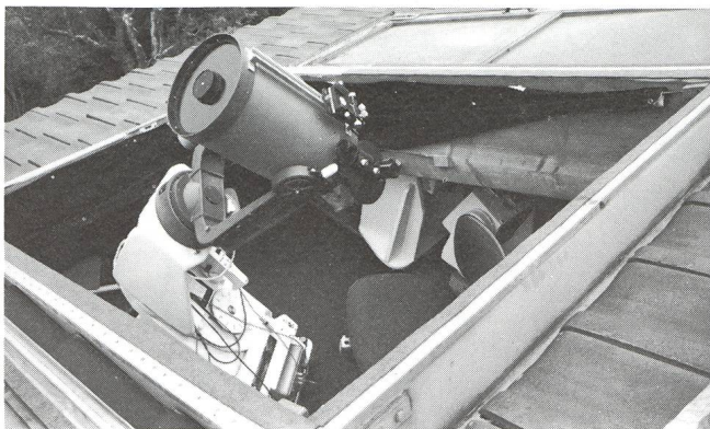
Ansicht der offenen Dachlücke von aussen mit Celestron 8 auf der in der ORION-Nr. 193 beschriebenen und seither erweiterten Montierung. Am Rahmen der Oeffnung befestigt erkennt man ein schwarzes Tuch, das durch ein Gestänge gespannt als Vorhang aufgerichtet werden kann. Es schützt gegen Wind und vorallem gegen Lichter der Umgebung.

Ein im Masstab 1 : 10 gefertigtes Modell erleichterte die Projektierung einer durch zwei Türflügel, wettersicher abschliessbaren Dachlücke. Die Grösse und Höhe der Oeffnung wurde durch das Gewicht der beiden mit verzinktem Eisenblech belegten Türen, die ein nicht zu mühsames Oeffnen und Schliessen gewährleisten sollten, bestimmt. Zwei Dachbalkenzwischenräume ergaben die Breite von 1,2 m und die Länge wurde mit 1,55 m bemessen. Ein knapper Beobachtungsplatz, aber genügend gross für eine Person, mit ringsum bequem erreichbarem Zubehör.