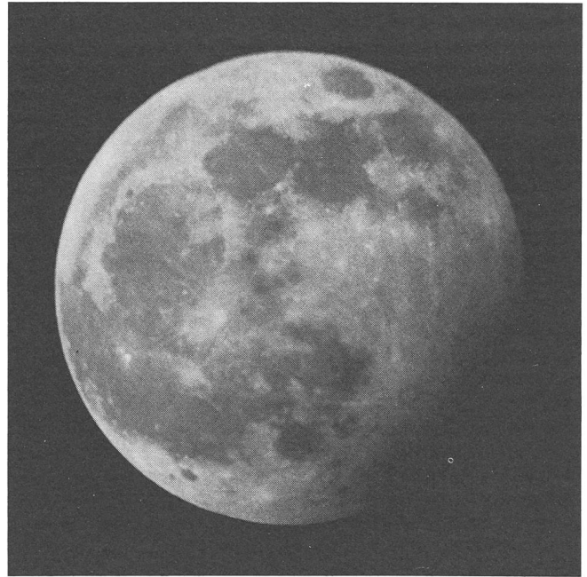
In der Nacht vom 19. auf den 20. Dezember berührte der Mond den Halbschatten der Erde, und wurde dadurch teilweise verfinstert. Dieser Vorgang konnte im Zürcher Oberland durch H. R. WIGET fotografisch festgehalten werden. Das Bild zeigt den Vollmond, welcher gegen die Südpolkalotte hin deutlich dunkler ist. Die Aufnahme wurde während der maximalen Phase gewonnen, da bei einer Halbschatten-Finsternis nur dann etwas sichtbar ist.