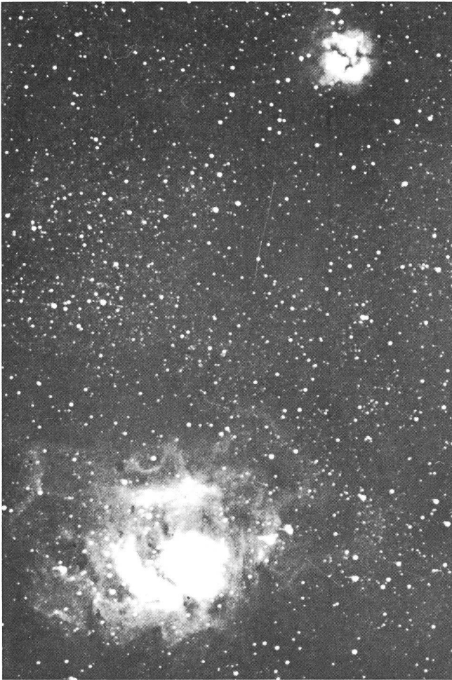
Abb. 1a: M8/M20 – Agrandissement normal du négatif d'origine. M8/M20 – Normale Vergrößerung des Originalnegativs.

on doit donc se procurer le hydroxyphenyl via une droguerie ou pharmacie.