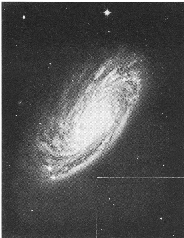
Abb. 1: Die Spiralgalaxie NGC 4501. Diese Galaxie ist ein Ebenbild der Milchstrasse; beide Galaxien sind vom selben Typ und leuchten etwa gleich stark. Das Rechteck am rechten unteren Bildrand gibt die relative Grösse der Abbildungen 2 und 3 an. Alle drei gezeigten Galaxien sind Mitglieder des Virgo-Haufens (Entfernung rund 60 Millionen Lichtjahre). Die lange Seite des Rechtecks, also auch die Breite der nachfolgenden Bilder, entspricht 3 Bogenminuten oder rund 60 000 Lichtjahren in der Distanz des Virgo-Haufens. Die Abbildungen sind Reproduktionen von Aufnahmen, die am 2.5 m-Teleskop des Las Campanas-Observatoriums in Chile gewonnen wurden (siehe Text).

Zwerggalaxien sind schwierig zu finden – eben weil sie so leuchtschwach sind. Immerhin sind etwa 25 Zwerggalaxien bekannt im Umkreis von 3 Millionen Lichtjahren. Die