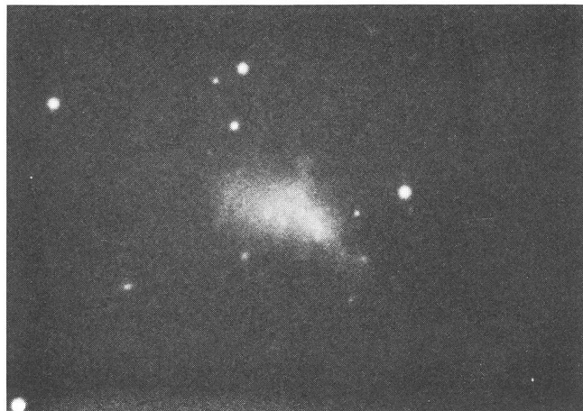
Abb. 3: Die irreguläre Zwerggalaxie IC3416. Siehe auch Text zu Abb. 1.

illustriert. Es handelt sich um zwei der hellsten Zwerggalaxien im Virgo-Haufen, die besonders fotogen sind. (Wir setzen also die Tradition fort und zeigen nur schöne Galaxien!)