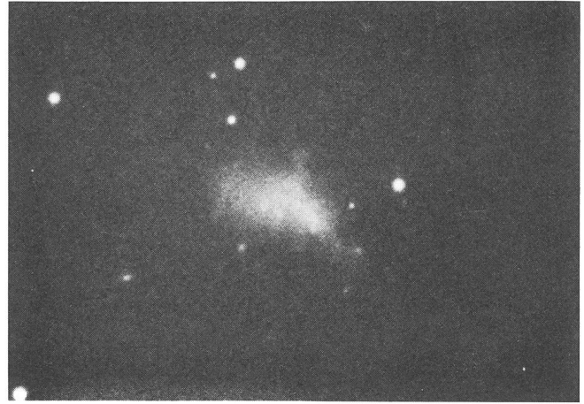
Abb. 3: Die irreguläre Zwerggalaxie IC3416. Siehe auch Text zu Abb. 1.

illustriert. Es handelt sich um zwei der hellsten Zwerggalaxien im Virgo-Haufen, die besonders fotogen sind. (Wir setzen also die Tradition fort und zeigen nur schöne Galaxien!)