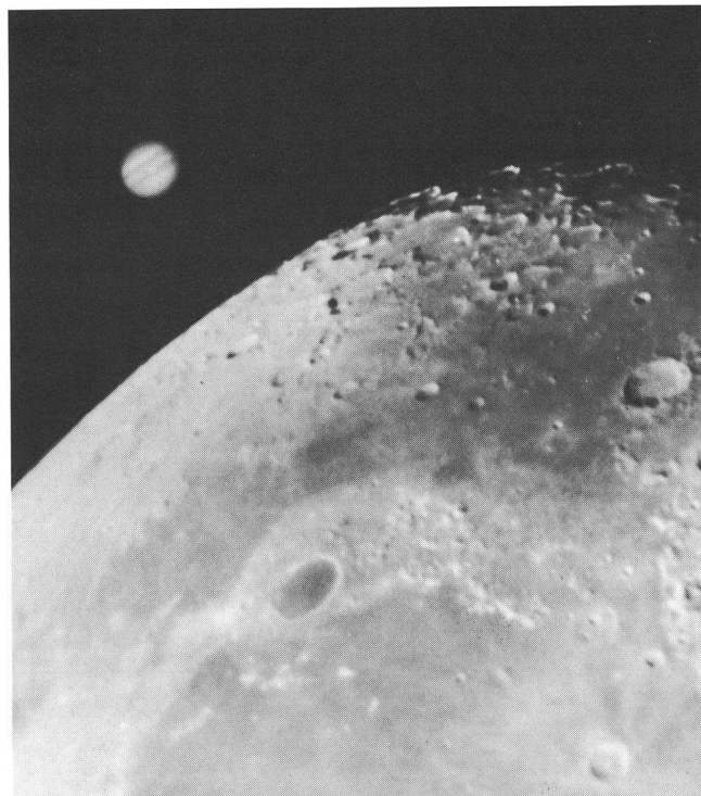
Aufnahme: 7. Januar 1980, 4.01 Uhr, mit einem Celestron 8.