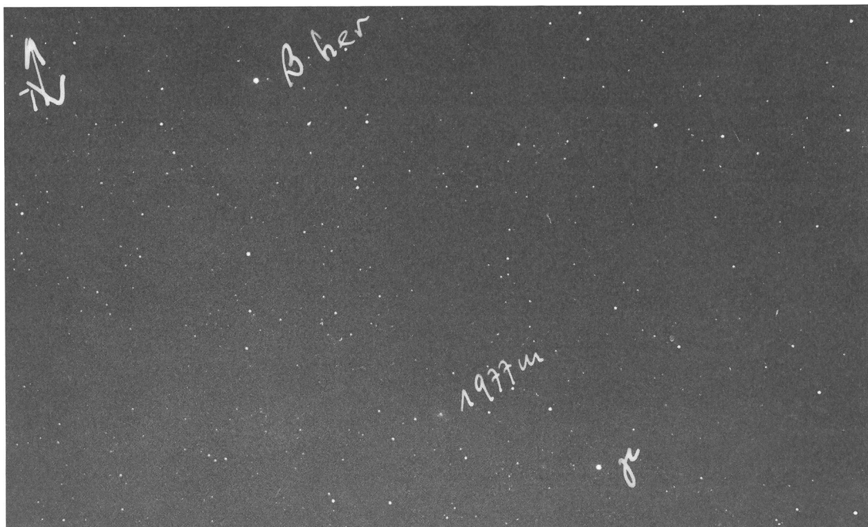
Diese früheste fotografische Aufnahme des Kometen KOHLER wurde der ORION-Redaktion von Dipl.-Ing. F. SEILER aus München zugestellt. Die Aufnahme stammt vom 30. September 77, 19h30 MEZ. Aufgenommen wurde sie auf Kodak 103aO mit der Maksutow-Kamera 150/200/350. Belichtungszeit: 1 Minute.