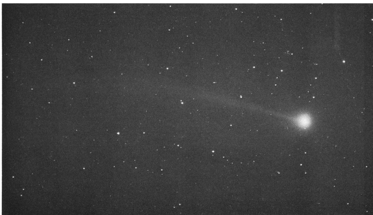
Bild 3: am 4. 8. 1975, 21 h 45–22 h 00, mit Kleinbild-Objektiv 500 mm 1:4.5, Kodak Tri-X-Film. Schweif ca 7° lang, Helligkeit ca. 4,5 m vis. Norden ist oben.