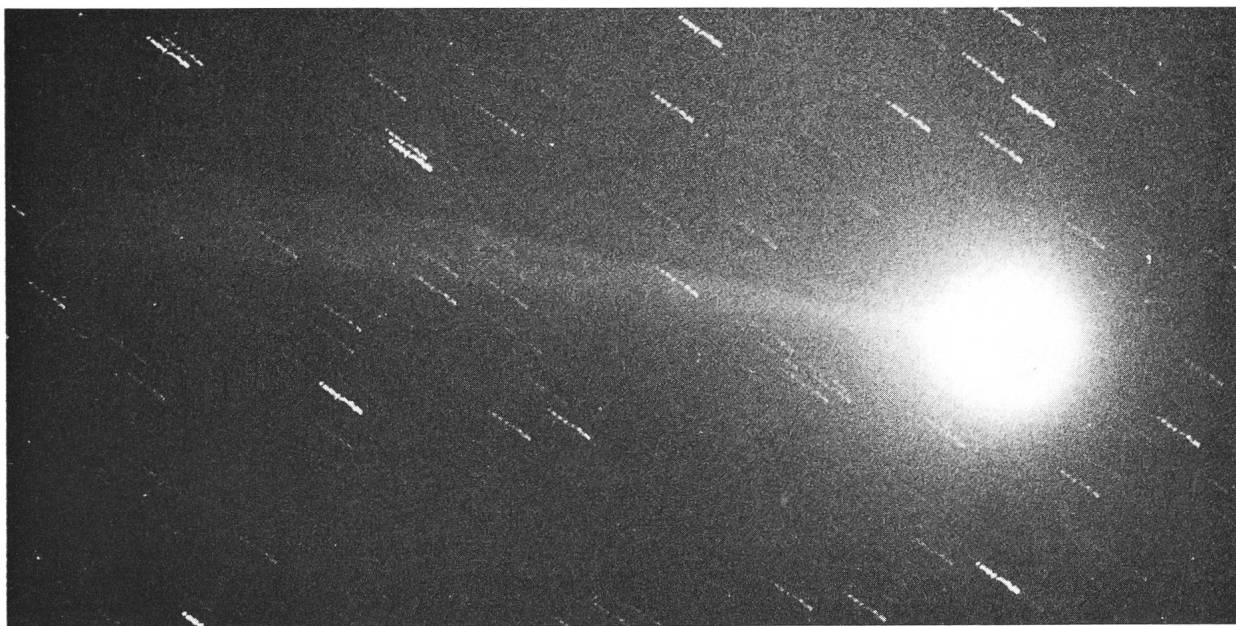
Bild 2: am 4. 8. 1975, 20 h 55–21 h 25 U.T. mit 200 mm NEWTON 1:6, 103 a0-Film. Norden ist oben.