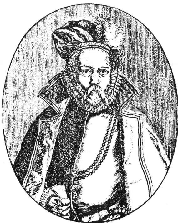
Abb. 1: TYCHO BRAHE (1546–1601), der dänische Meisterbeobachter der vortelekopischen Zeit, galt bis ins 19. Jahrhundert als Erstentdecker des nach ihm benannten neuen Sternes.

« De nova Stella », die kleine, aber doch recht ausführliche Schrift von TYCHO BRAHE, fand in Europa grosse Beachtung, und vielleicht war die dadurch erlangte Popularität des Dänen mitentscheidend, dass lange Zeit die Erstentdeckerehren am neuen Stern auf ihn zurückfielen – der Name «TYCHONISCHER Stern» zeugt heute noch davon.