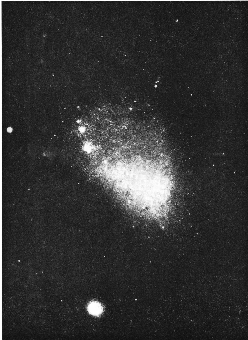
Fig. 2: Le Petit Nuage de MAGELLAN photographié à l'aide du télescope SCHMIDT du Royaume-Uni, de 1,2 m de diamètre. Il vient au second rang des galaxies extérieures les plus proches et contient environ 10^9 étoiles. On peut voir au centre de la photo légèrement sur la gauche un amas stellaire globulaire appelé Tucanae 47, qui se trouve dans notre galaxie et contient environ 10^6 étoiles.

les plus distants de tous ceux que l'on a observés jusqu'ici dans l'Univers et s'il en est ainsi, ils donneraient des informations sur l'Univers datant de 5 \times 10^{10} ans (soit le temps pris par les ondes électromagnétiques pour parvenir à la terre à partir de la source).