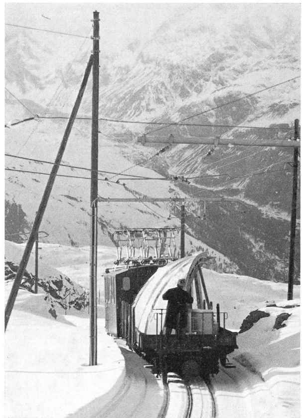
Coupole quittant le Gornergrat pour Vevey.

La Société d'Astronomie de La Tour-de-Peilz vient de bénéficier d'un don d'une valeur exceptionnelle: En effet, la Fondation «Hochalpine Forschungsstation Jungfraujoch + Gornergrat» lui a remis une coupole d'acier de 4,8 m de diamètre ainsi que l'excellente monture équatoriale qui l'équipait. La coupole garnissait l'une des tours de l'hôtel du Gornergrat et va être remplacée par une construction plus importante. La monture, construite au début de ce siècle, a été constamment modernisée, elle est apte à recevoir sans problèmes un instrument de 40 cm. La clause fixée par la Fondation est que ces matériels soient réinstallés d'ici une année environ et servent entre autre à l'information du public et, spécialement, de la jeunesse.