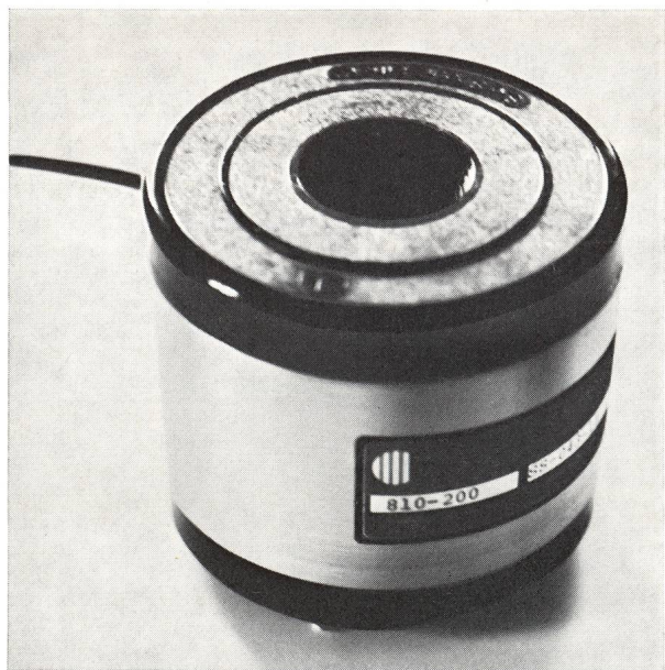
Abb. 1: Thermostat mit eingebautem Interferenzfilter. Masse: 89 mm Durchmesser, 75 mm Höhe. Einbau: mit 3 Schrauben an Grundplatte oder passender Wiege.