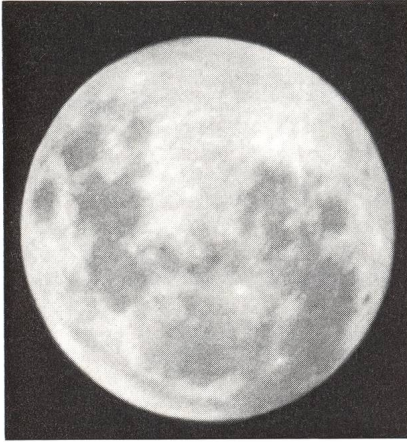
Bild 1 Aufgenommen 10. 12. 73 02.00 Uhr MEZ Belichtungszeit \frac{1}{2} s Beginn der Finsternis