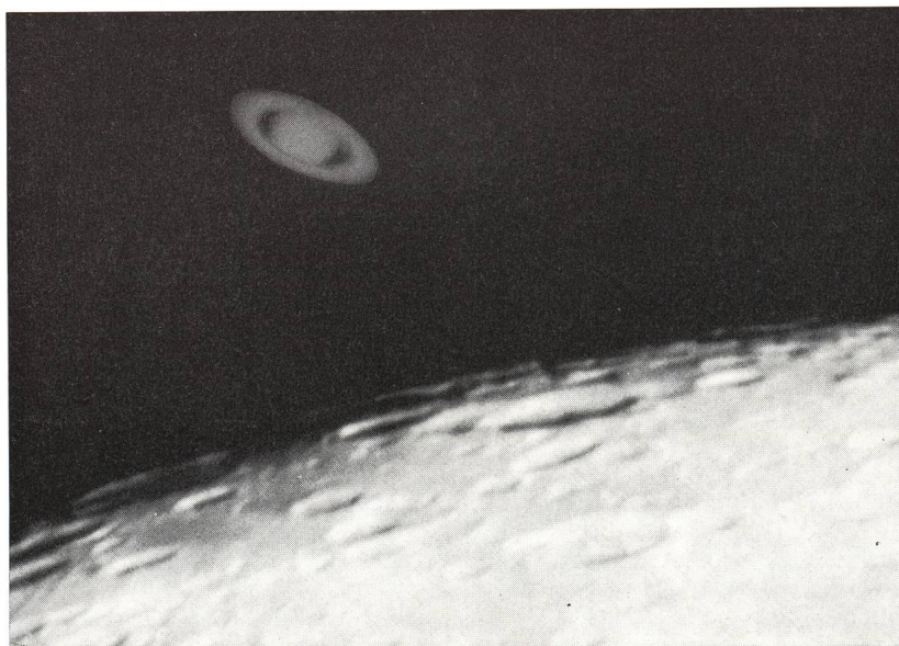
Der Ringplanet Saturn neben dem Erdmond.

planeten nahe dem Erdtrabanten im Bilde festzuhalten. Eine solche Aufnahme sandte uns Herr HANS BERNHARD aus München. Wir möchten sie unseren Lesern nicht vorenthalten!