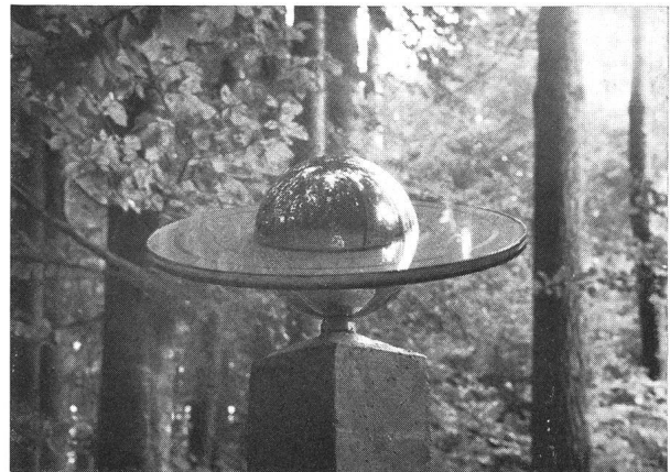
Oben: Jupiter. Unten: Saturn

erfolgte bei Kälte und Schneetreiben der Aushub der über einen Meter tiefen Löcher für die Fundamente. Am Ostersonntag und -montag wurden diese dann betoniert. Anfangs Mai begann das eigentliche Setzen der Himmelskörper mit der Montage der Sonne: Dank dem Einsatz der grossen Motordrehleiter der Wehrdienste Burgdorf erreichte sie mühelos ihren endgültigen Standort auf einem alten EW-Kandelaber. Sukzessive wurden in den folgenden Wochen die Giessharzwürfel und grossen Planetenkugeln auf die speziell hergestellten Betonsäulen montiert und diese in die vorbereiteten Fundamente verankert. An jeder Säule orientiert eine auf Aluminium gedruckte Karte über die wichtigsten physischen Daten des Planetensystems sowie über den einzuschlagenden weiteren Weg.