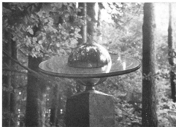
Oben: Jupiter. Unten: Saturn

erfolgte bei Kälte und Schneetreiben der Aushub der über einen Meter tiefen Löcher für die Fundamente. Am Ostersonntag und -montag wurden diese dann betoniert. Anfangs Mai begann das eigentliche Setzen der Himmelskörper mit der Montage der Sonne: Dank dem Einsatz der grossen Motordrehleiter der Wehrdienste Burgdorf erreichte sie mühelos ihren endgültigen Standort auf einem alten EW-Kandelaber. Sukzessive wurden in den folgenden Wochen die Giessharzwürfel und grossen Planetenkugeln auf die speziell hergestellten Betonsäulen montiert und diese in die vorbereiteten Fundamente verankert. An jeder Säule orientiert eine auf Aluminium gedruckte Karte über die wichtigsten physischen Daten des Planetensystems sowie über den einzuschlagenden weiteren Weg.