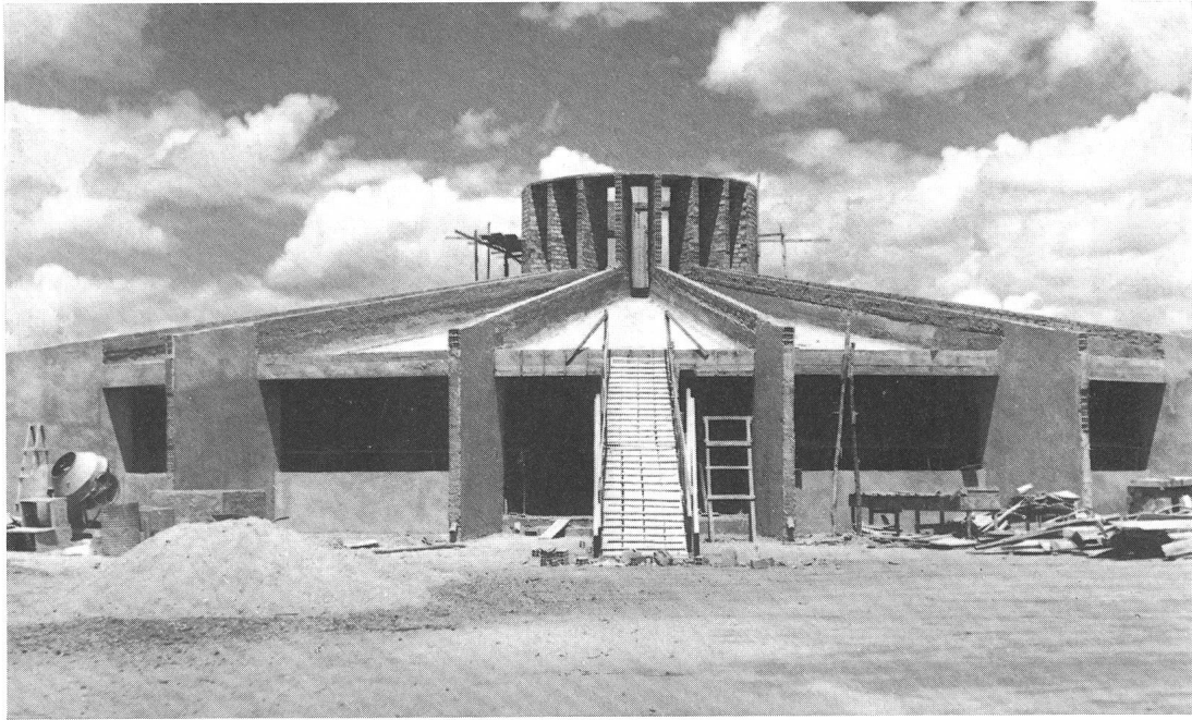
Fig. 1; Die im Bau befindliche Antares-Sternwarte in Feira de Santana.