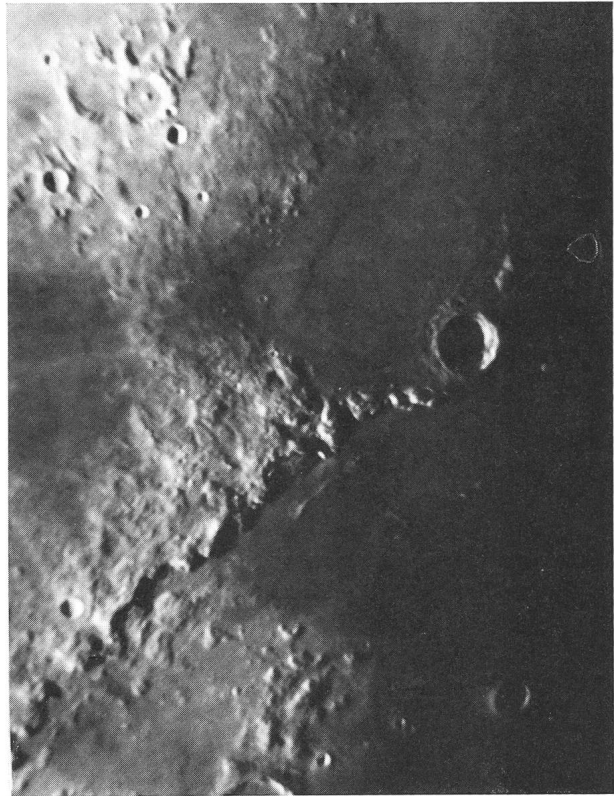
Abb. 2: Apenninen mit Eratosthenes Aufnahme am 5. 3. 1971