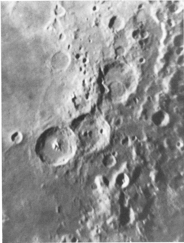
Abb. 1: Theophyllus-Catharina-Cyrillus Aufnahme am 3. 3. 1971