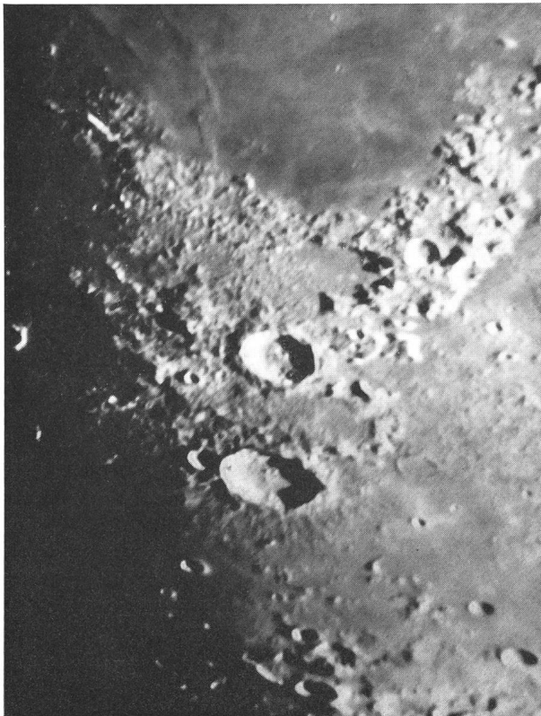
Abb. 3: Aristoteles und Exodus Aufnahme am 10. 9. 1971