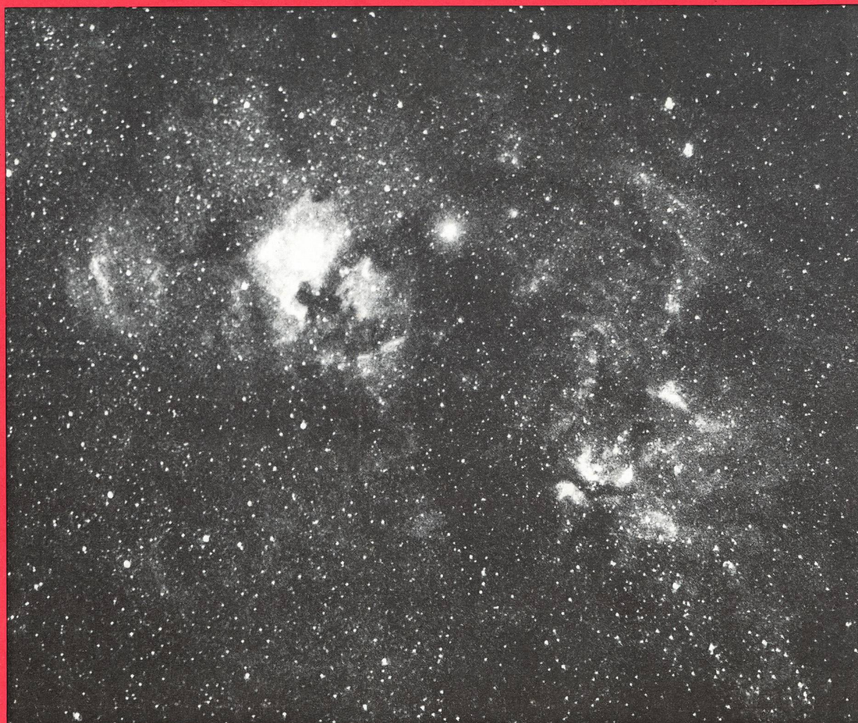
Milchstrasse im Schwan. Aufnahme von G. Klaus mit Zeiss-Sonnar 1:1,5 und Schott-Interferenzfilter auf Kodak 103a-E-Film. Belichtungszeit 30 Minuten. Weitere Stellaraufnahmen: In diesem Heft.

Zeitschrift der Schweizerischen Astronomischen Gesellschaft Bulletin de la Société Astronomique de Suisse