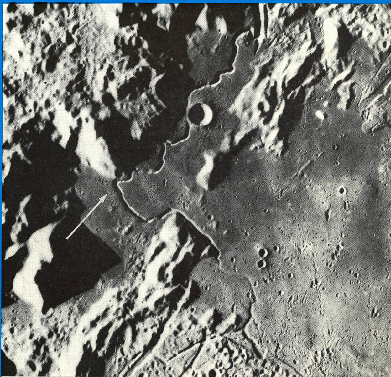
Landeplatz der Apollo XV-Fähre mit David Scott und James Irvin zwischen der Hadley-Rille und den Apenninen. Auf der Originalaufnahme ist die Landefähre (Ort durch Pfeil markiert) eben noch erkennbar. Anblick der Gegend wie im umkehrenden astronomischen Fernrohr (Norden ist unten, Sonne steht links). Aufnahme von Al Worden aus der Kommandokapsel auf Mondumlaufbahn mit der 75 mm Karten-Kamera.

Bulletin de la Société Astronomique de Suisse