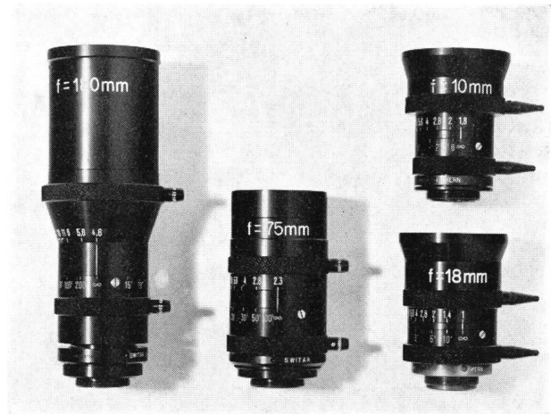
Die von Kern entwickelte und gebaute Serie von Hochleistungsobjektiven für die in den Apollo-Programmen verwendete 16-mm-«Data Acquisitions»-Filmkamera.

Die Kern-Objektive werden mit der sogenannten «Data-Acquisition»-Filmkamera verwendet. Sie dient dazu, nach einem bis in alle Einzelheiten festgelegten