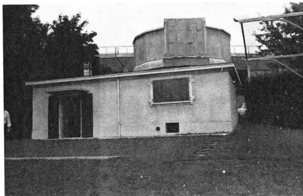
Nouvel observatoire de la SVA, diamètre de la coupole 5.5 m.

Il faut souligner un fait important: la SVA ne disposant pas de fonds nécessaires à ces réfections, c'est