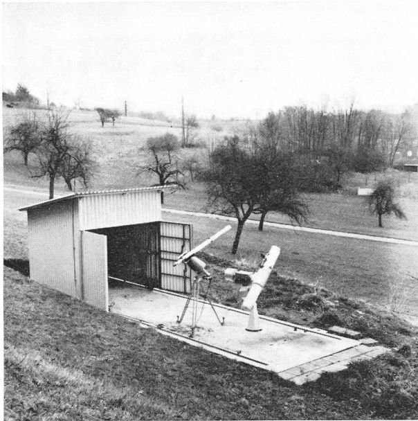
Abb. 2: Gesamtansicht der Beobachtungsstation auf dem Gempen-Plateau (Gemeinde Seewen SO).

L'observatoire du plateau de Gempen (Soleure) avec l'abri glissant sur deux rails en tubes d'acier et tôle ondulée.