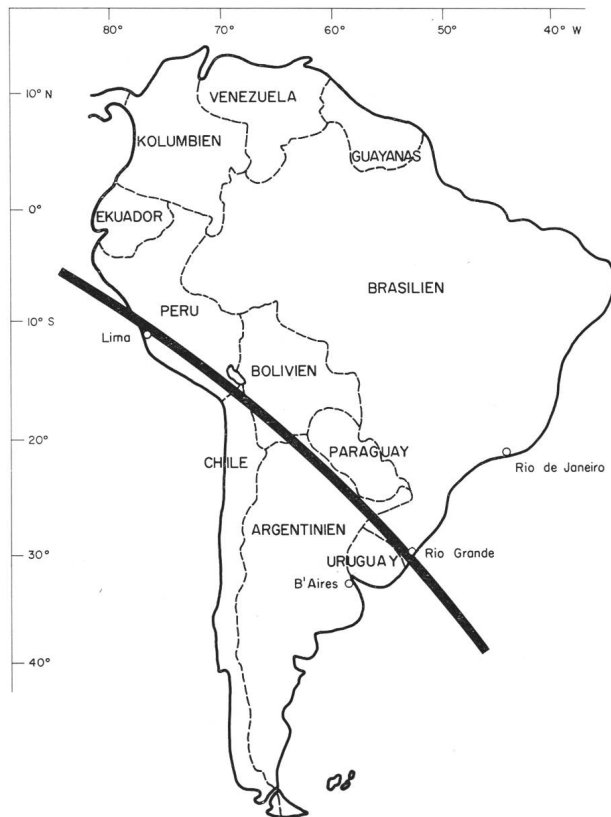
Abb. 1: Verlauf der Totalitätszone der Sonnenfinsternis am 12. Nov. 1966 durch Südamerika.

Etwa 500 Beobachtungsstationen waren auf dem Kontinent zur Verfolgung dieses astronomischen Ereignisses vorbereitet. Wissenschaftler aus aller Welt kamen ausserdem mit eigenen speziellen Beobach-