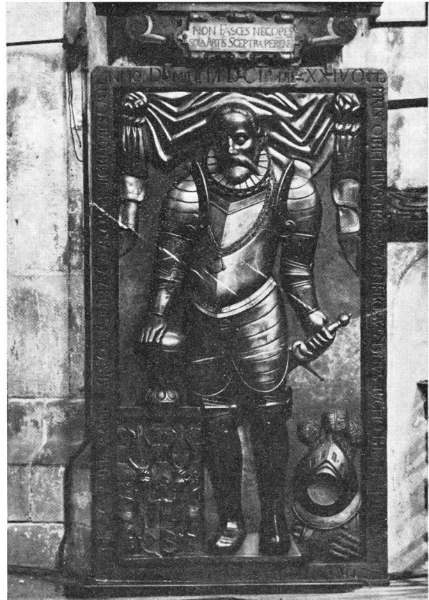
Grabplatte Tycho Brahes in der Teinkirche auf dem Altstätterring in Prag.

nissen der Planeten die weltbildenden mathematischen Verhältnisse seien, welche er zu enträtseln habe. Dies waren die Gedanken und Überlegungen, die ihn zur Entdeckung der Planetengesetze führten.