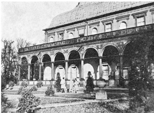
Das Schloss Belvedere in Prag, eine der schönsten Renaissancebauten nördlich der Alpen, erbaut in den Jahren 1538–1563. Von der oberen Plattform diente das Schloss als Sternwarte für Tycho Brahe und Kepler.

Ebenso wie TYCHO BRAHE schrieb er auch gute Gedichte, die der Astronomie viel Gunst brachten. Als Dichter und Künstler hat er den Wert der Astrologie geschätzt, als Wissenschaftler sah er ihren Untergang. Es ist nicht zu leugnen, dass die Renaissancezeit der Astronomie, in der er lebte, zu den merkwürdigsten Zeiterlebnissen der Menschheit gehört. In Prag hat sich die astronomische Renaissance zur höchsten Blüte entfaltet, hier spielte sich der Kampf der Titanen ab. Die entstehende neue Astronomie, die KEPLER so wunderbar in seiner « Astronomia Nova » ins Leben rief, zerstörte den Himmel der Götter und griff tief in das Seelenleben der Menschheit ein.