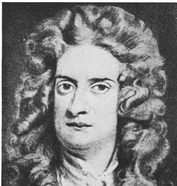
Newton (1642 - 1727)

Newton à ce moment déjà avait un grand nom dans l'optique. Quand Halley vint lui parler du problème qui le préoccupait, Newton lui dit qu'il s'y était intéressé et l'avait même complètement résolu ; mais malgré l'insistance de Halley, il ne put mettre la main sur son travail et dut le reconstituer de mémoire. Cela montre que plutôt que de provoquer des discussions, Newton préférait laisser dormir ses mémoires dans un tiroir et les y oublier.