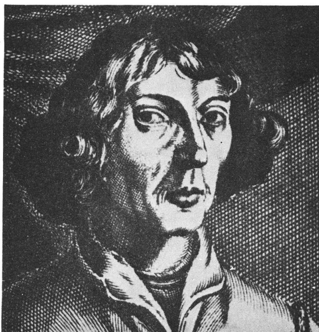
Copernic (1473 - 1543)

Ses instruments d'étude furent les tables basées sur le système de Ptolémée et celles basées sur le système de Copernic. Avec ces tables, il constata de nombreuses erreurs entre la prévision et les phénomènes. Il se rendit compte qu'il était nécessaire de calculer la position des étoiles avec la plus haute précision et de déterminer la trajectoire de chaque planète par rapport à ces repères avec une rigueur égale. Ces deux objectifs nécessitent l'usage d'instruments de grande taille, parfaitement construits.