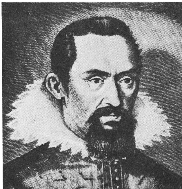
Kepler (1571 - 1630)

Kepler se plaça d'emblée dans l'hypothèse copernicienne et énonça la première loi capitale: chaque planète décrit une ellipse dont le soleil occupe un des foyers. La deuxième loi, dite loi des aires, suivit de près. Dix ans plus tard, Kepler dans un nouvel ouvrage, affirme la troisième loi dont l'expression mathématique est :