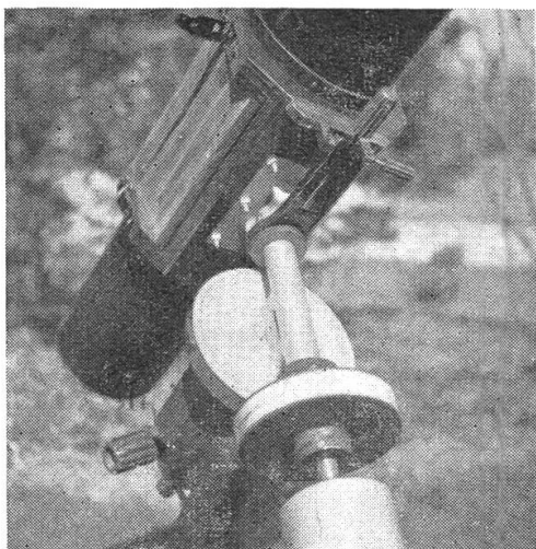
Rohrwiege, Deklinations-Feinbewegung und Teilkreise