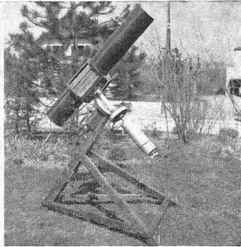
In zwei Minuten in Bereitstellung

wendung von Velobestandteilen. Damit war das Wesentliche festgelegt, der Rest bestand in Detailausführungen und Wahl des geeigneten Materials.