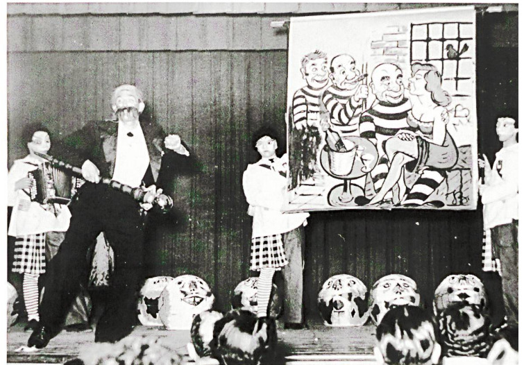
Oben: Landhockey-Finalspiel des Stadtrivalen HC Blau-Weiss Olten gegen Stade Lausanne 1953 auf der Schützenmatte.