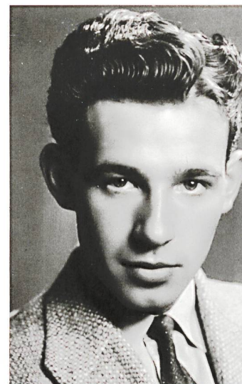
Eine gerahmte Vergrösserung dieses Kinderporträts hing viele Jahre im Schaufenster des Fotoateliers Bolz an der Unterführungsstrasse 27 (1949). Daneben Porträt eines jungen Mannes von zwanzig Jahren (1946)