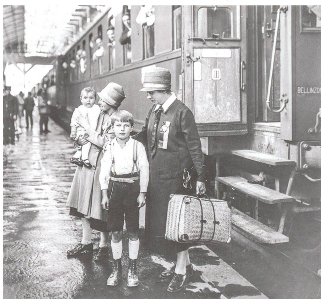
FJM-Bahnhofsagentinnen in einem Schweizer Bahnhof, um 1930

Das FJM-Netzwerk wurde von evangelischen Kreisen ins Leben gerufen. Im katholisch geprägten Kanton Solothurn wird es bis heute massgeblich vom Netzwerk der Reformierten Kirche getragen. Das Engagement des Vereins beruhte statuarisch «auf der im Evangelium erhaltenen christlichen Grundlage» 23 und verstand sich ursprünglich als Diakonie. Der Kampf gegen den Frauenhandel wurde gewissermassen «mit Gottes Hilfe» gefochten – programmatisch lautete der Titel des deutschschweizerischen Verbandsblattes «Aufgeschaut! Gott vertraut!» – und auch symbolisch unter den Schutz und Schild des heiligen Michael gestellt. Die Arbeit der FJM stand aufgrund ihrer evangelischen Basis zudem der Inneren Mission 24 nahe. Die Freundinnen wollten nicht nur Schutz bieten, sondern auch christliche Werte vermitteln. Trotz evangelischer Basis war die konkrete Arbeit der FJM explizit überkonfessionell ausgerichtet: «Wir sind unabhängig von einer bestimmten Kirche und brauchen keine konfessionelle Bezeichnung im Namen