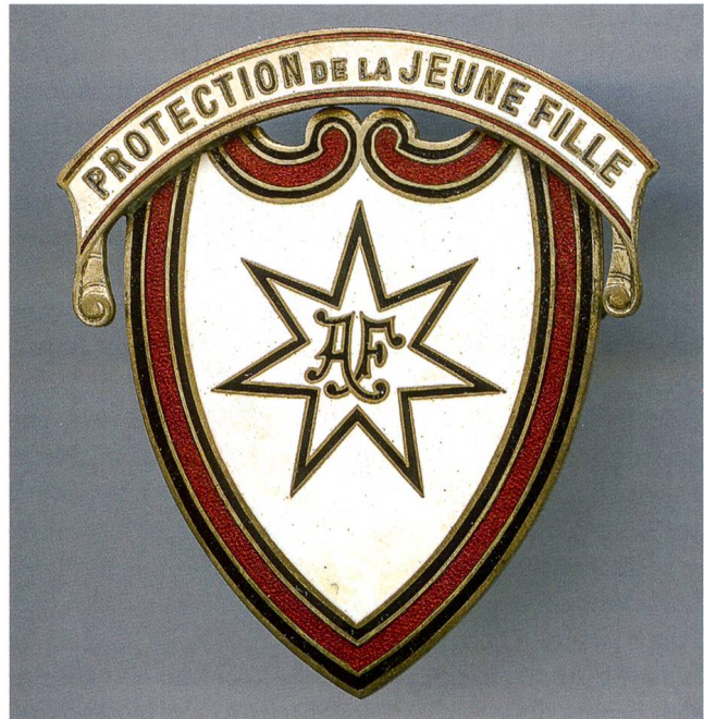
Freundinnen-Brosche. Siebenzackiger Stern im Schild des Heiligen Michael

Der Netzwerkgedanke knüpfte an bekannte Grundstrukturen der frühen bürgerlichen Frauenbewegung. Anders als die meisten Vereine entwickelten sich die FJM allerdings nicht aus der lokalen Ebene hin zu einem nationalen