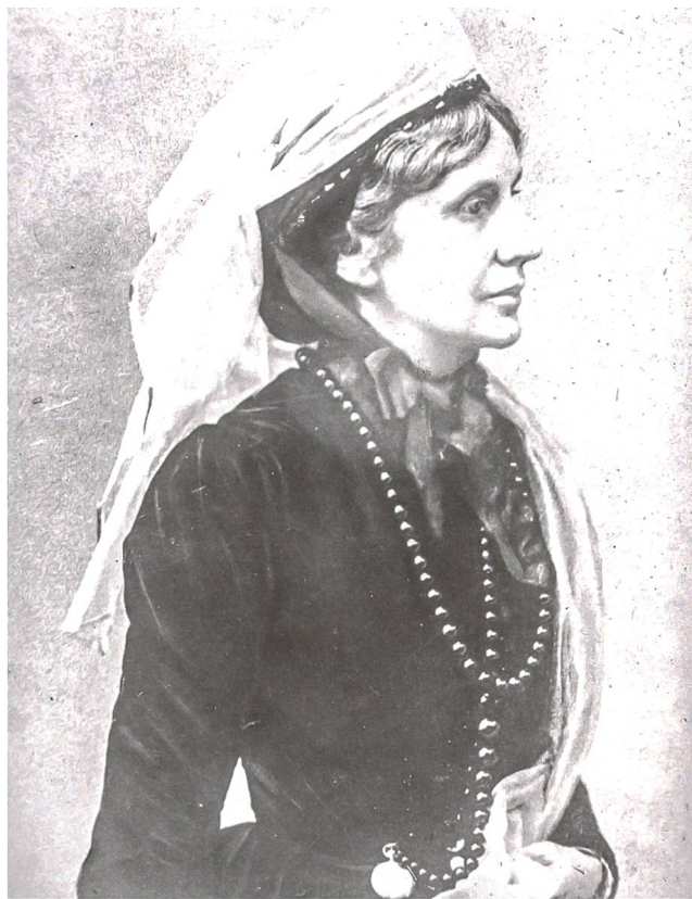
Josephine Butler, Gründerin des Internationalen Vereins der Freundinnen junger Mädchen, Porträt um 1870

Der Start gestaltete sich schwierig. Die nötigen finanziellen Mittel waren krisenbedingt kaum aufzubringen. 15 Die Anregung des Nationalvereins, «ob nicht in Olten eine Dame zu finden wäre, die den Dienst einer Agentin freiwillig übernehmen würde», wurde von der Sektion entschieden abgelehnt: «Man ist allgemein der Ansicht, dass man diese Aufgabe jetzt Niemandem zumuten könne und dass es in Olten überhaupt schwierig sei, diesen Posten nur von einer Person auszufüllen, da zu gleicher Zeit Züge in verschiedenen Richtungen ankommen.» 16 Der Dienst am Bahnhof war längst zur professionellen sozialen Dienstleistung geworden, welche, fahrplandeckend, durch besoldetes und ausgebildetes Personal geleistet wurde. Entsprechend das Anforderungsprofil an die Agentin: «Erstens, dass sie ein Abzeichen trage, das einige unschön und schwerfällig finden; dann dass sie unauffällig, aber sorgfältig gekleidet sei, weder zu elegant, noch zu einfach. Man verlangt von ihr, dass sie ausser ihrer Muttersprache noch eine oder zwei Sprachen spreche, stets guter Gesundheit und heiterer, angenehmer, freundlicher Stimmung sei; ferner über ein feines Taktgefühl verfüge, das ihr ein gutes Einvernehmen mit dem Bahnhofpersonal sichert, ohne mit diesem auf vertraulichem Fuss zu stehen. Mit sicherem Blick soll sie das geringste zweideutige Vorgehen erfassen und über grosse Geistesgegenwart verfügen, um komplizierte Fälle