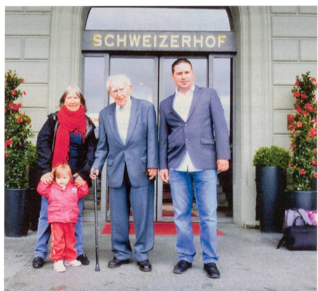
Vier Generationen vor dem Hotel Schweizerhof am 15. Mai 2014