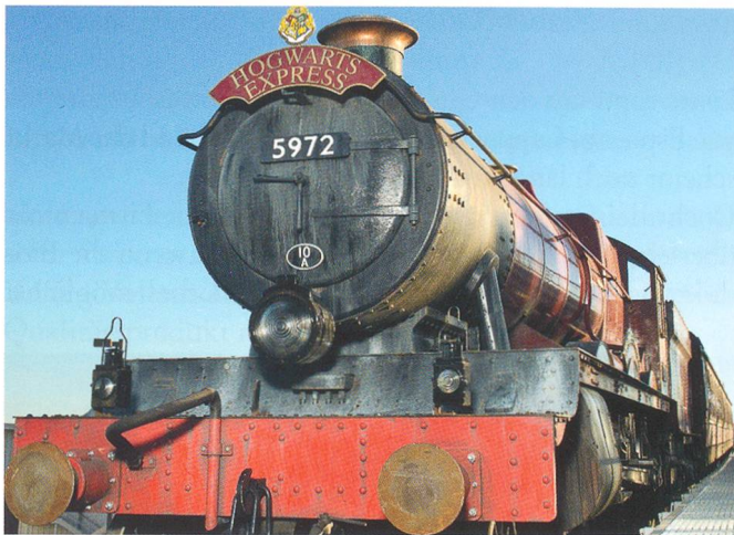
Hogwarts Express, Universal Studios Orlando, USA

nen Anforderungen gerecht und haben am Markt den unerreichten Standard für Kabinen im Bereich Einseilumlaufbahnen gesetzt. Parallel zum 75-Jahr Firmenjubiläum darf CWA im 2014 auch da 30-Jahr Jubiläum der Erfolgskabine OMEGA feiern.