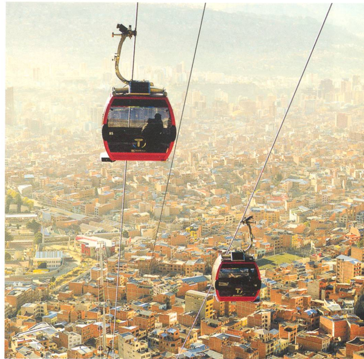
La Paz, Bolivien