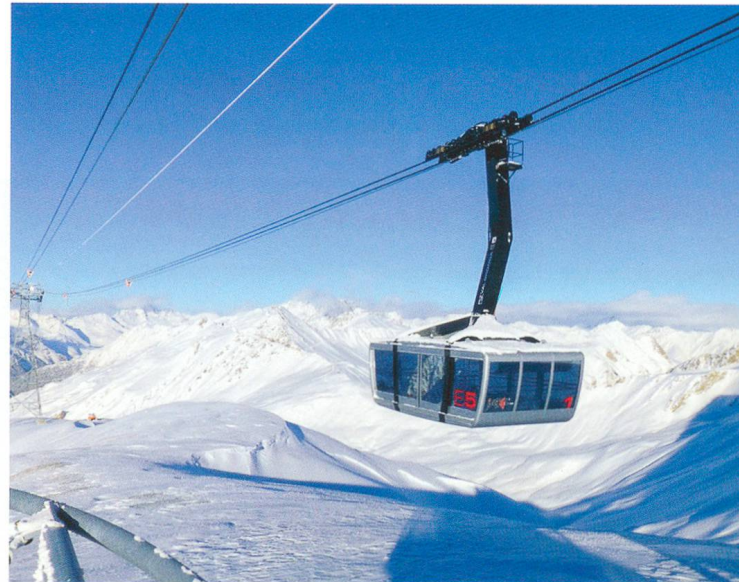
Piz Val Gronda, Oesterreich