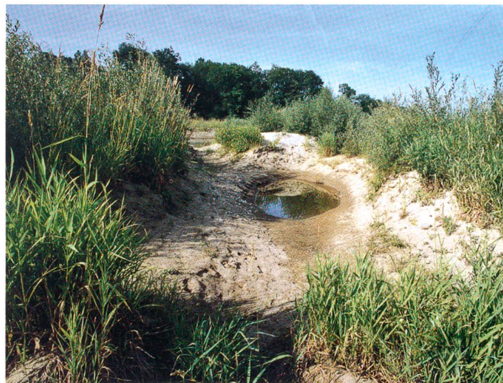
Hier soll ein Auenwald entstehen.

Unterhalb des Lageplans befinden wir uns im unteren strukturreichen Abschnitt des Umgehungsgewässers. Dieses erstreckt sich auf 740 m Länge im alten Kraftwerkskanal. Es besteht aus einer Abfolge von flach überströmten,