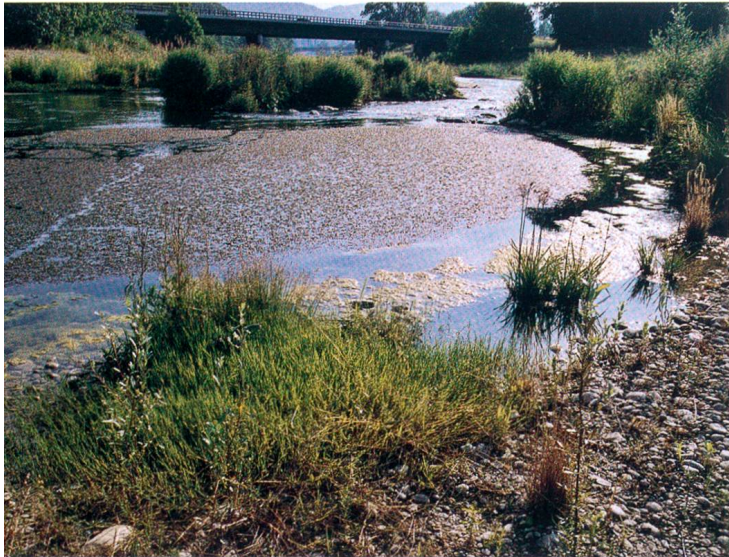
und ruhigen Flachwasserzonen

kiesigen Schnellen mit einer parallel dazu verlaufenden, tieferen Rinne und einem daran anschliessenden strömungsberuhigten Bereich. Kieslaicher wie die Forelle und die Barbe haben unterschiedliche Ansprüche an ihren Lebensraum: Während die Forelle zum Ablachen eher Feinkies benötigt, liebt die Barbe eher Grobkies, und strömungsliebende Insekten brauchen eine grobe Kiessohle zum Verstecken. Dies wurde bei der Gestaltung der Stromschnellen berücksichtigt und somit optimale Bedingungen geschaffen für die Fortpflanzung. Strukturelemente aus Kies fügen sich zu einem vielfältigen Lebensraum zusammen. Da eine ungestörte Entwicklung Voraussetzung ist für das Überleben dieser besonderen Spezialisten, die in ihrem Bestand in der Schweiz bedroht sind, und auf den rohen Kiesböden eine allmähliche Besiedelung durch die Pflanzenwelt stattfindet, die sich laufend verändert, sollten die Menschen auf den für sie vorgesehenen Bereichen bleiben. 14