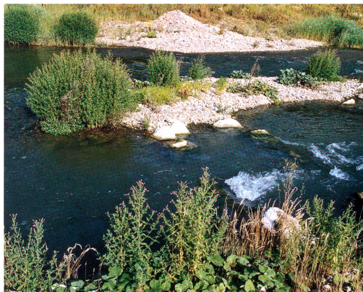
Strukturiertes Umgehungsgewässer mit Kieshaufen ...