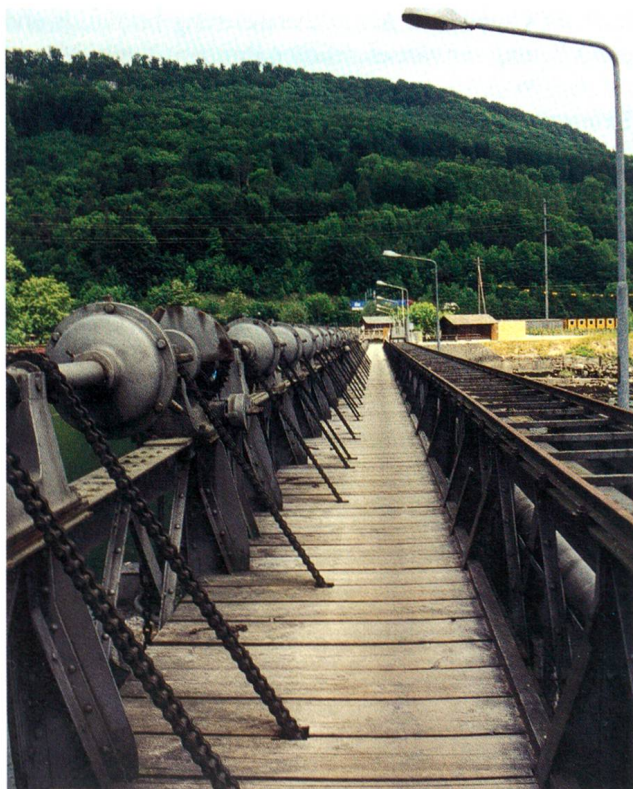
Der viel begangene Weg über das alte Wehr

Nebst einer modernen Produktionsanlage wurde Lebensraum für Mensch und Natur geschaffen. Auf einer Strecke von 8,4 km entstanden Flachwasserzonen, Inseln und natürliche Entwicklungsflächen (Sukzessionsflächen). Der Auenwald wurde vervielfacht auf ein Gebiet von 5,2 ha. Mit diesen Massnahmen wurde ein wesentlicher Beitrag zum Naturschutz geleistet, der über das eigentliche Projektgebiet hinaus zur nachhaltigen Verbesserung des Ökosystems Aare beigetragen hat. Gleichzeitig hat sich die Flusslandschaft zu einem beliebten Natur-Erlebnisraum für Spaziergänger und Erlebnissuchende entwickelt. 8